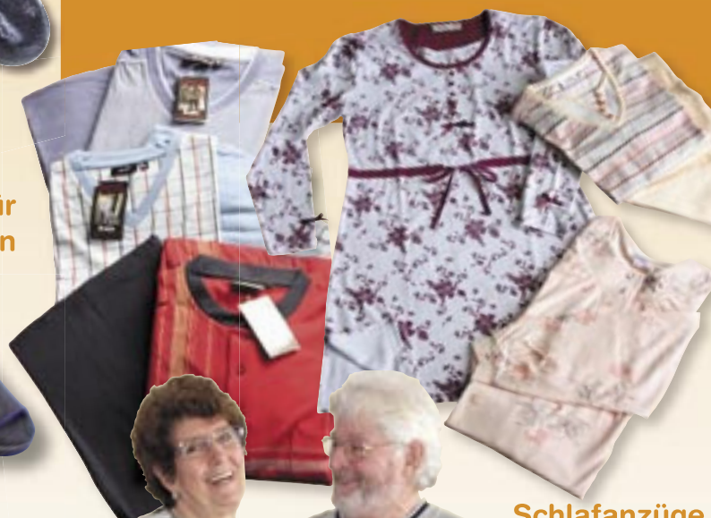
Schlafanzüge und Nachthemden für Damen und Herren