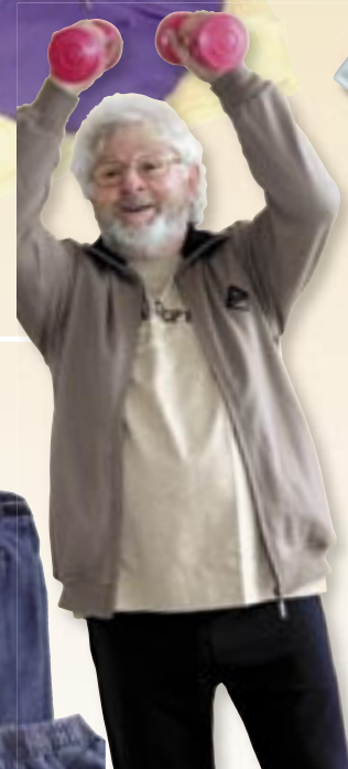
Bequeme Jogginghosen und Freizeitanzüge