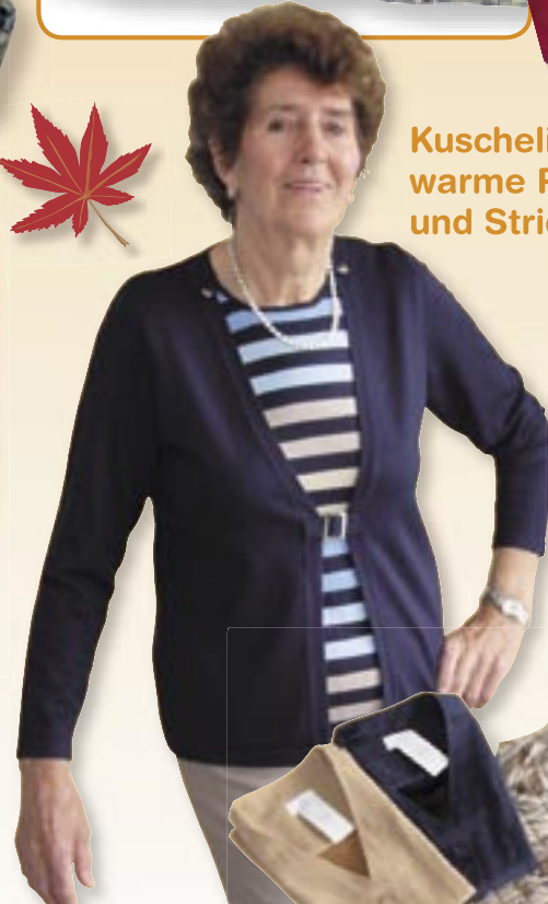
Kuschelig warme Pullover und Strickjacken