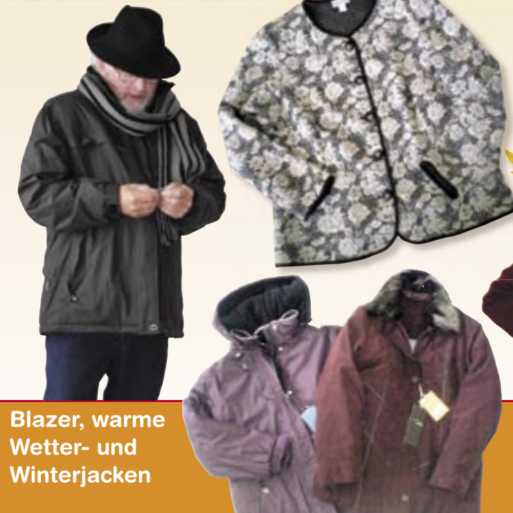
Blazer, warme Wetter- und Winterjacken