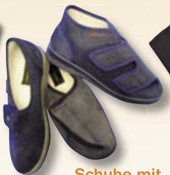
Schuhe mit Klettverschluss in G- und H-Weite